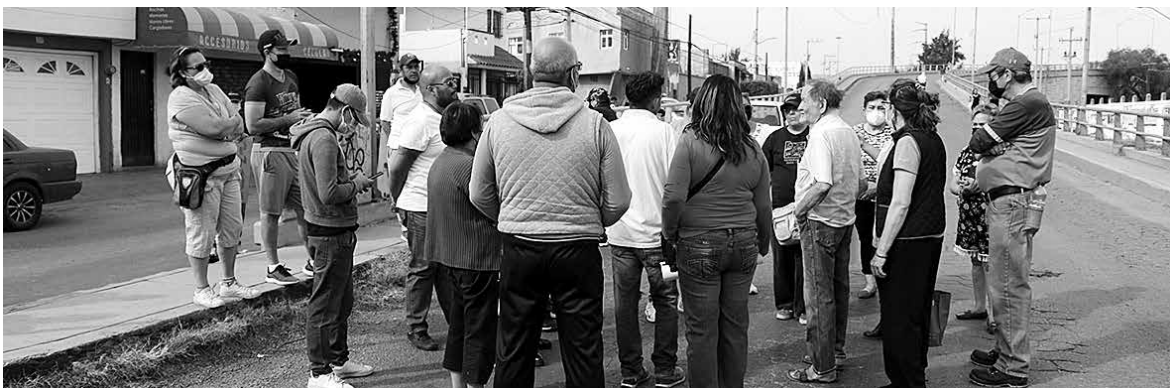
Los manifestantes exigen una solución definitiva al desabasto que enfrentan.