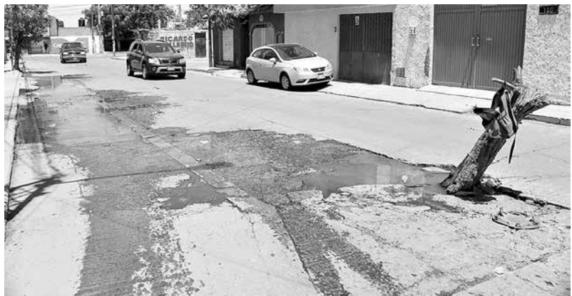
El organismo asegura que en breve solucionarán su problema.

El organismo operador atiende, de continuo, reportes del mismo tipo en casi toda la ciudad debido a que la red de drenaje, por su antigüedad, presenta fallas frecuentes a causa de los materiales desgastados e incluso obsoletos que la forman.